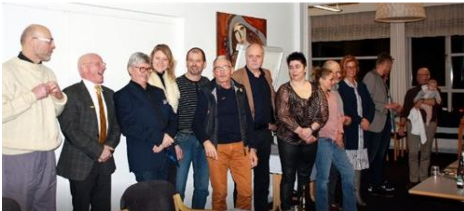
Modtagere af 10 år nåle på rad og række - Tillykke til jer alle